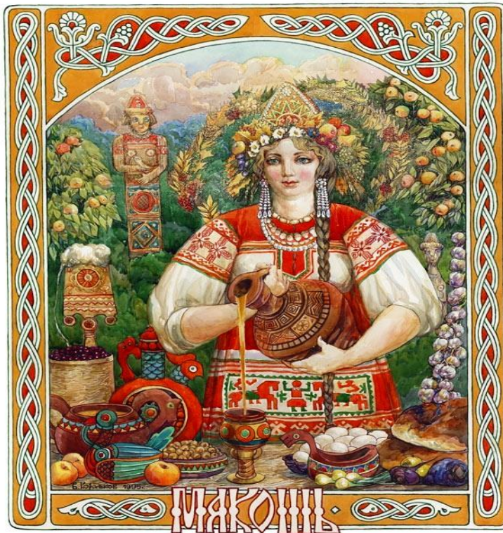
Приложение № 7