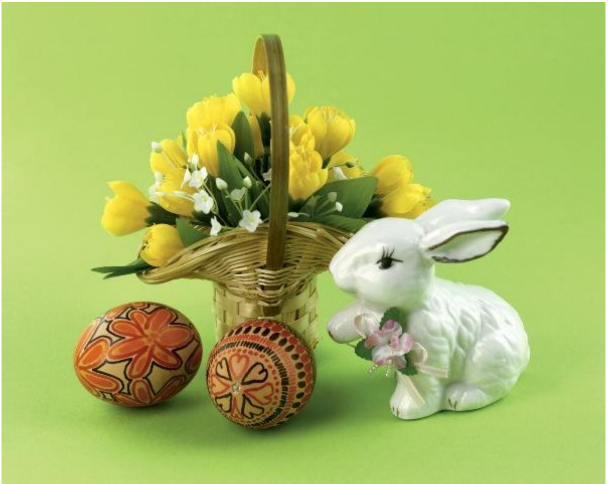
Приложение № 3 Масленица