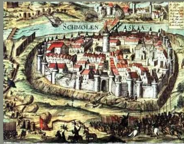
Осада Смоленска польскими войсками 1609-1610 гг.