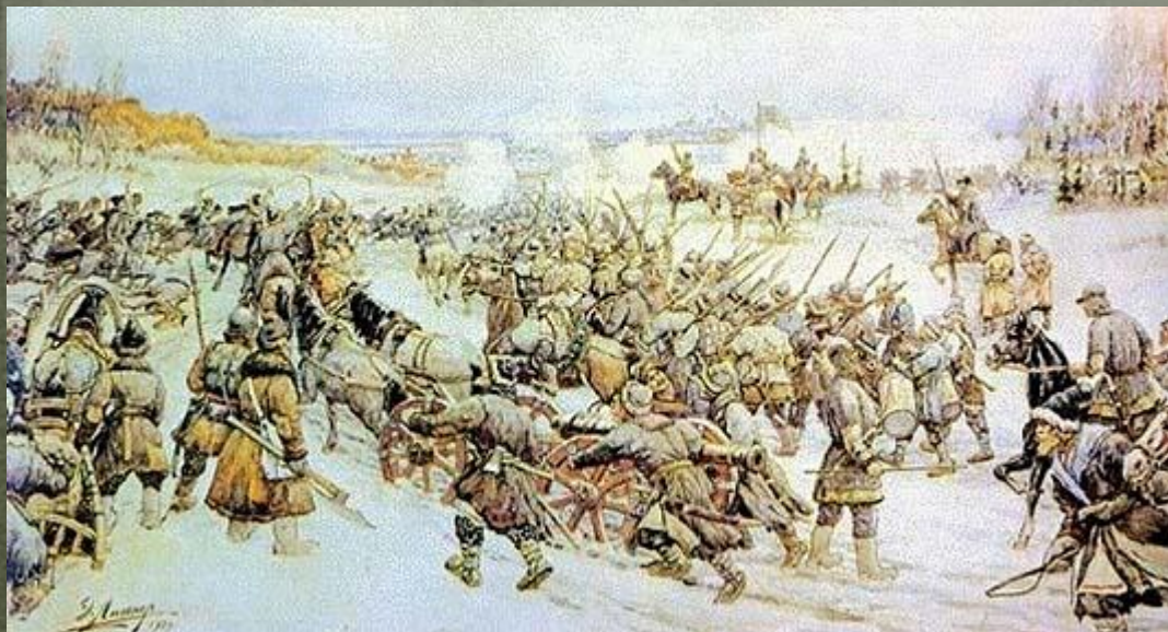
Битва войска И. Болотникова с царской армией под Москвой